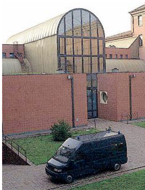
PROCESSO Ieri la sentenza in tribunale

Secondo alcuni testimoni, avvicinata da una vettura con a bordo tre perso-