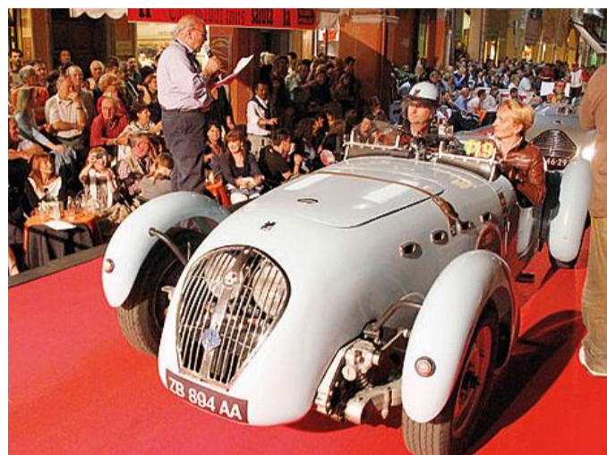
L'arrivo della Mille Miglia a Cento lo scorso anno