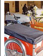
I cargo-bike presentati ieri

Completamente finanziato dalla Comunità Europea il progetto IEE - Uso intelligente dell'energia nei trasporti - Cyclologistics è approdato ieri a Ferrara, scelta come città pilota. Propone l'uso di cargo-bike (biciclette attrezzate per vari tipi di trasporti, dai bambini fino a un quintale di merce) al posto delle auto. Di queste speciali biciclette che in qualche modo sono già utilizzate da chi ci porta a casa la pizza,