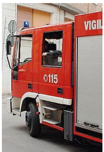
Vigili del fuoco al lavoro

Chiamati da un passante, sono arrivati immediatamente i vigili del fuoco di Ferrara che hanno lavorato per oltre quattro ore. Per fortuna le persone all'interno dell'abitazione sono rimaste illese. Al lavoro anche gli uomini della polizia municipale che hanno provveduto a rimuovere le macerie ed i pezzi carbonizzati che cadevano dall'alto durante le operazioni dei vigili del fuoco.