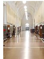
L'interno del tribunale

Una situazione che sarebbe cominciata diverso tempo prima, ma che solo un particolare episodio, per il quale si è reso necessario l'intervento dei carabinieri, ha poi portato all'attenzione della magistratura. Il procedimento giudiziario ora è approdato all'udienza preliminare: il tribunale ha deciso di nominare un perito per valutare il racconto dei due minori, per verificare l'attendibilità delle accuse alla madre.